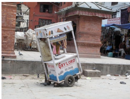
Figura 1: Vendedor de Kwality “Ice-Kream” em Katmandu.

Na mítica cidade de Katmandu, no Nepal, os vendedores ambulantes do tradicional e delicioso gelado Kwality costumam preservá-lo em “arcas” arrefecidas com azoto líquido (Fig. 1). Nesta prova experimental, vamos determinar o calor latente de evaporação do azoto líquido (ou variação da entalpia no processo de evaporação) que é a energia necessária para evaporar um grama de azoto líquido à pressão atmosférica ambiente.